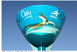
Hình ảnh ASIAD 15 trên nắp nước ở Dota